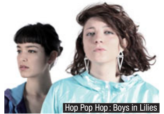
Hop Pop Hop : Boys in Lilies