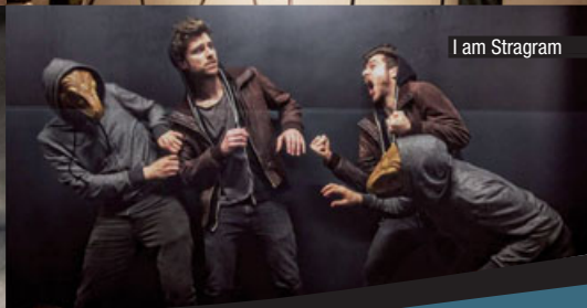
I am Stragram