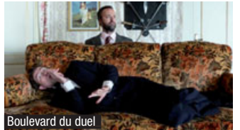
Boulevard du duel