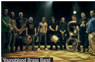
Youngblood Brass Band