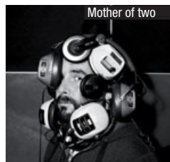
Mother of two