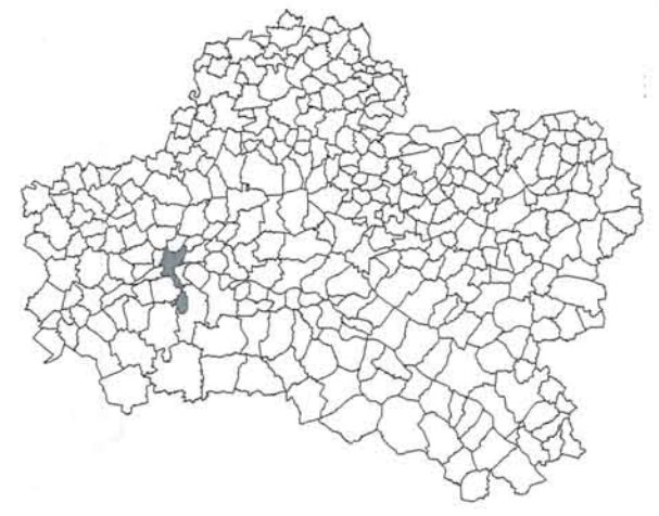
Département du Loiret

Echelle : 1:25000 SCAN 25® - ©IGN, Paris 2001 - Licence 2000/CUIN/9036 ; S.R.A. / JV / édition du 08/2003