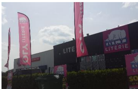
Enseignes en drapeau et en clôture