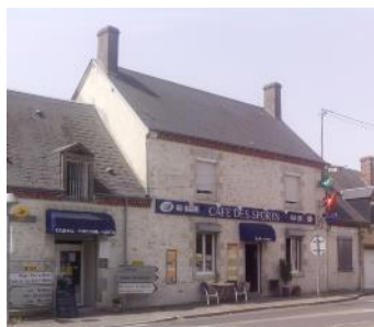
Enseignes de petits commerces