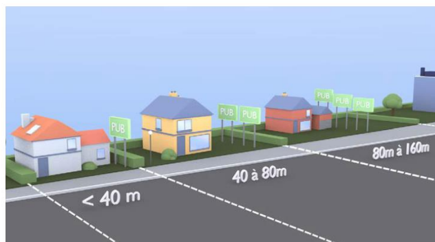
Un dispositif dans l'unité foncière dont la longueur bordant la voie est inférieure ou égale à 40 m. Deux dispositifs entre 40 m et 80 m. Un dispositif supplémentaire par tranche entamée de 80 m.