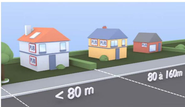
Deux dispositifs muraux dans l'unité foncière dont la longueur bordant la voie est inférieure ou égale à 80 m à la condition d'être superposés ou juxtaposés. Un dispositif supplémentaire par tranche entamée de 80 m.

[Art. R581-55 CE] Aucune règle d'inter-distance n'est imposée, sauf pour les bâches publicitaires, dont l'inter-distance est de 100 mètres.